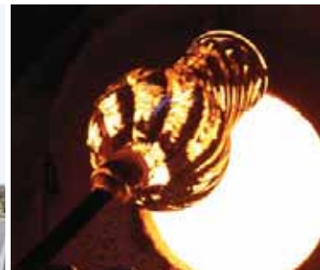
Links: Natürlich waren wir auch kurz zu Besuch im ersten Ikea der Welt; heute ein Museum. Rechts: Glasbläserkunst in Kosta.

meint er. Das setzte natürlich voraus, dass wir überhaupt irgendwann mal einem Gesetzeshüter begegnen würden, doch die sind hier noch seltener als alle anderen Menschen, und schon denen begegnen wir relativ selten. Wahre Freiheit eben.